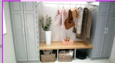
玄関脇のクローク

うきうき楽しい春の訪れのはずが、新型コロナウイルスのせいで、手放しで喜ばないモヤモヤ気分のまま春を迎えました。色んな方面で、皆さんの厳しい状況が伝えられておりますが、そんな中でも、色々なアイデアでこの状況を乗り切ろうと頑張ってる方々のように、常に前向きな発想を持って行けたらと思います。さて今回は、三井ホーム様の仙台港モデルハウスをご紹介します。興味のある方は、是非モデルハウス展示場でじっくり見学して下さいね。