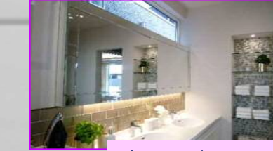
洗面・ランドリースペース