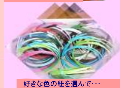
好きな色の紐を選んで…