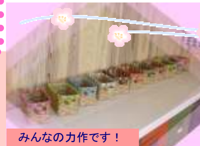
みんなの力作です!

2月20日(日) 大好評! クラフトバック教室を開催致しました。今回も定員オーバーでお断りした方、すみません!! 次回は、お早めの予約をおすすめ致します。