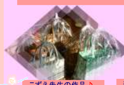
こずえ先生の作品♪