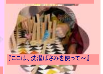
『こは、洗濯ばさみを使って〜』