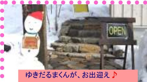
ゆきだるまくんが、お出迎え♪