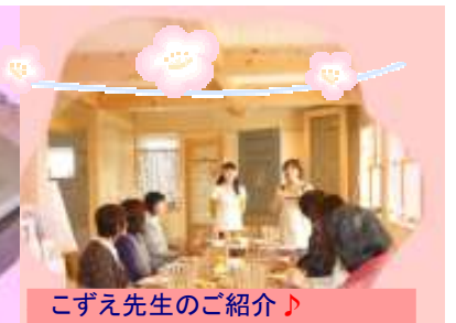
こずえ先生のご紹介♪