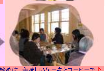
締めは、美味しいケーキとコーヒーで♪