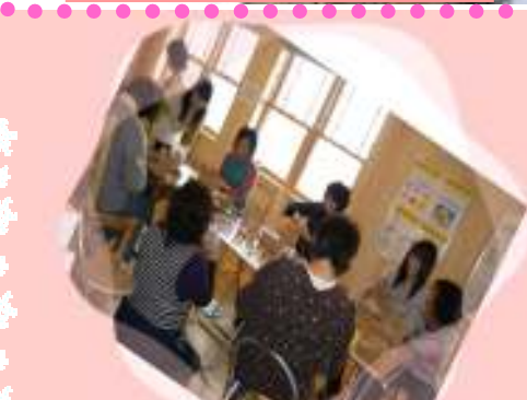
一度始めたら、もう夢中♪